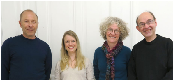
Le Comité de l'ACAT-Suisse

L'ACAT-Suisse est membre de l'organisation faïtière FIACAT (Fédération internationale des ACAT).