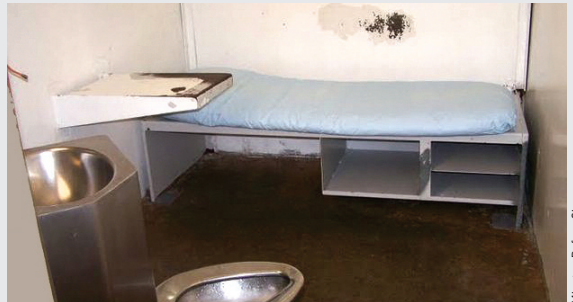
Minutes Before Six