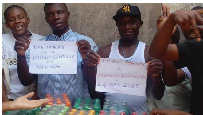
Repas de Noël offert aux mineurs de la prison de Kondengui le 24 décembre