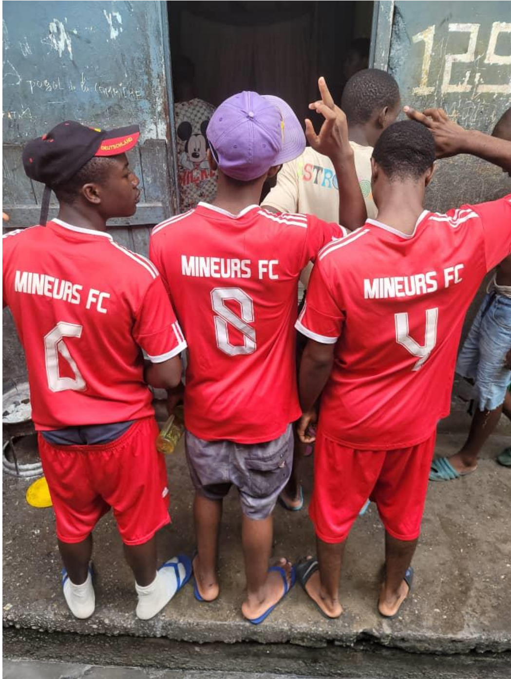
Equipe de football du quartier des mineurs de la prison centrale de Yaoundé

PHOTO PAGE DE COUVERTURE : don de fournitures scolaires et de matériel de couture