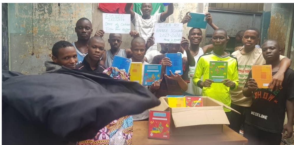
Don de fournitures scolaires et matériel de couture

Des fournitures scolaires (des cahiers, crayons, stylos, ardoises, craies, règles, etc.) ont été distribués aux mineurs de la Prison Centrale de Yaoundé pour le compte de la rentrée scolaire 2023-2024, les cours se poursuivent normalement.