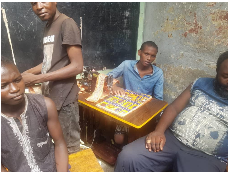
Jeune en formation de couture

EMINED a offert un lot de matériel d'apprentissage aux jeunes détenus de la prison centrale de Yaoundé. Ce matériel a été mis à la disposition des ateliers de formation en couture, tissage des sacs, cordonnerie, couture moderne et traditionnelle. La formation s'est déroulée pendant 6 mois, au total 40 jeunes ont été formés et ont reçu une attestation de fin de formation. Ils sont capables désormais de réaliser des produits tels que : les vêtements, les sacs en main, les bracelets, les colliers et les chaussures.